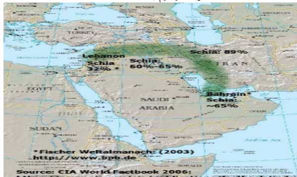
کمربند موسوم به هلال شیعه

شیعیان در خاورمیانه در یک کمان استراتژیک با عنوان هلال شیعه واقع شده‌اند که از لبنان شروع و تا یمن در پایین عربستان امتداد پیدا می‌کند. این بخش‌ها سواحل شمالی و جنوبی خلیج فارس را شامل می‌شود و بخش‌هایی از جنوب سواحل عراق، کویت، استان‌های شرقی عربستان سعودی (احساء، قطیف)، سواحل بحرین و قسمت‌هایی از سواحل قطر و بندر دبی در امارات متحده عربی را دربر می‌گیرد. در واقع، به لحاظ جغرافیایی مهم‌ترین بخش‌های خاورمیانه و بخصوص خلیج فارس در اختیار شیعیان است و به تعبیر فرانسوا توال خلیج فارس از نظر جغرافیای مذهبی تحت سلطه شیعیان است و یا به قول نوام چامسکی که گفته بود: «از سر یک تصادف جغرافیایی منابع اصلی نفت جهان عمدتاً در مناطق شیعه‌نشین خاورمیانه یعنی جنوب عراق، مناطق شرق عربستان و ایران قرار دارد» (Chomsky, 2007, 85). میدان نفتی "رومیله" در جنوب عراق با تولید روزانه ۲ میلیون بشکه نفت خام، منطقه "بورگان" در جنوب کویت محل بارگیری نفت خام استخراج‌شده از میدان نفتی بورگان با تولید روزانه ۱.۷ میلیون بشکه، ابرمیدان نفتی "قوار" عربستان با تولید روزانه ۵ میلیون بشکه در روز، همه در مناطق شیعه‌نشین کشورهای یادشده می‌باشند.