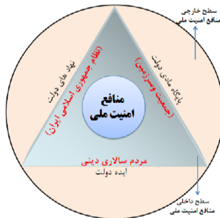
شکل ۱: مثلث منافع امنیت ملی ج.ا.ایران و سطوح داخلی و خارجی آن

این مفهوم به زیرساخت‌های عینی دولت، شامل مردم، سرزمین، ثروت و منابع آن گفته می‌شود (بوزان، همان، ص ۱۱۲).