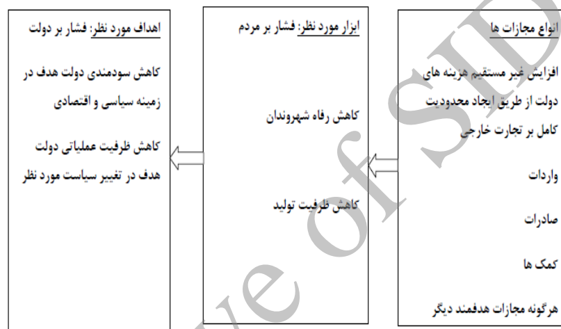
شکل ۳. اهداف راهبردی آمریکا و اتحادیه اروپا از تحریم اقتصادی ایران

تحریم اقتصادی ایران را می‌توان در قالب سیاستگذاری چندجانبه نامتوازن جهان غرب تحلیل کرد. هدف اصلی ایالات متحده آمریکا افزایش غیرمستقیم هزینه‌های دولت از راه ایجاد محدودیت کامل بر تجارت خارجی بوده است. این محدودیت‌ها در حوزه‌های تجارت خارجی، مالی، فناوریانه و دیپلماتیک اعمال شده است. همان‌گونه که در شکل ۳ مشاهده می‌شود، هدف آمریکا و اتحادیه اروپا از اعمال سیاستگذاری چندجانبه نامتوازن، کاهش قابلیت‌های عمومی دولت و جامعه است. نشانه‌های این فرایند در شکل ۳ مشاهده می‌شود.