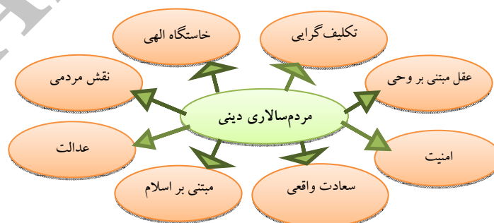
نمودار ۱. ویژگی‌های مردم‌سالاری دینی

- نظام مردم‌سالاری دینی، حکومتی مبتنی بر عقل است. حکومتی منطقی و معقول و به دور از ستیزه‌گری و سلطه و تحمیل (بیانات، ۶۰/۱۷/۱۰).