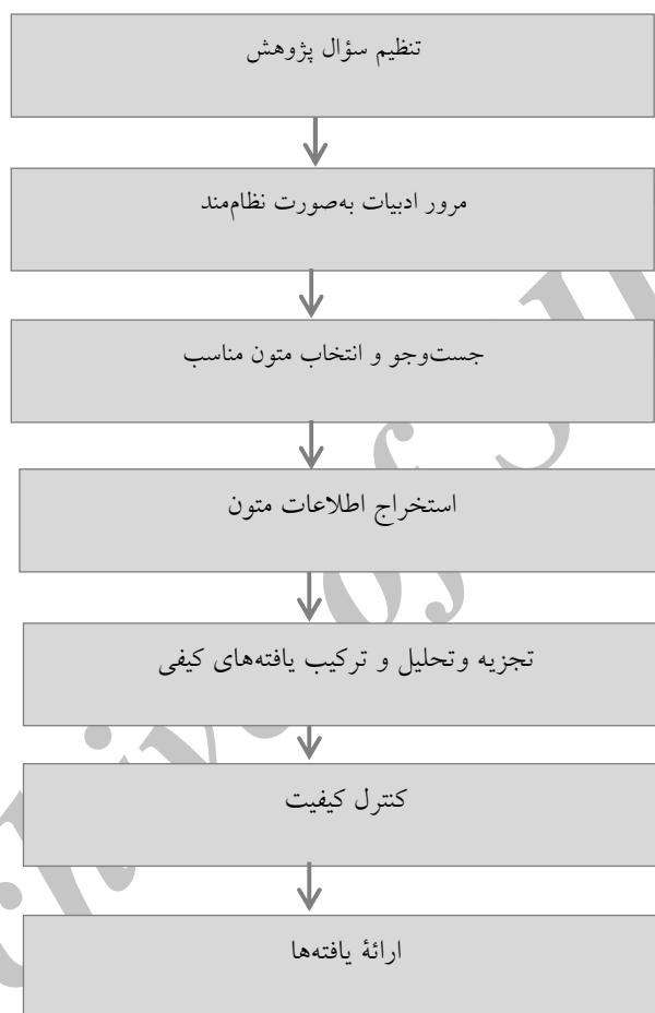
شکل ۲. مراحل پیاده‌سازی روش فراترکیب (Sandelowski, 2007)

در پژوهش حاضر برای تبیین روش‌شناسی فراترکیب از رویکرد هفت‌مرحله‌ای باروسو و ساندلوسکی استفاده شده است.