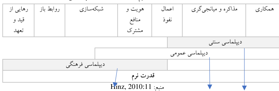
جدول ۲. ارتباط قدرت نرم و اشکال مختلف دیپلماسی

همان‌گونه که جدول ۲ برمی‌آید، قدرت نرم در همه اشکال دیپلماسی نهفته است. از دید نای، ترکیب اطلاعات مستقیم دولتی با مناسبات بلندمدت فرهنگی، به سه دایره هم‌شکل بستگی دارد. نخستین دایره، ارتباطات روزانه است که بافت و محتوای تصمیمات سیاست داخلی و خارجی را در برمی‌گیرد و باید آمادگی مقابله با بحران‌ها را داشته باشد. عرصه یا دایره هم‌شکل دوم، ارتباطات راهبردی است که موجد مضامینی ساده و بیشتر شبیه به عملکرد برنامه‌های سیاسی یا تبلیغی است. رخدادهای خاصی چون نمایشگاه شانگهای ۲۰۱۰ در این دسته می‌گنجد. سومین و گسترده‌ترین میدان، توسعه مناسبات پایدار با عناصر اساسی است که طی سالیان یا حتی دهه‌ها از راه بورس‌ها، تبادلات دانشجویی، برنامه‌های آموزشی، سمینارها و کنفرانس‌ها شکل می‌گیرد (نای، ۱۳۹۲: ۱۴۹). دقیقاً در همین سومین میدان از دیپلماسی عمومی است که دیپلماسی علمی و فناوری متولد می‌شود.