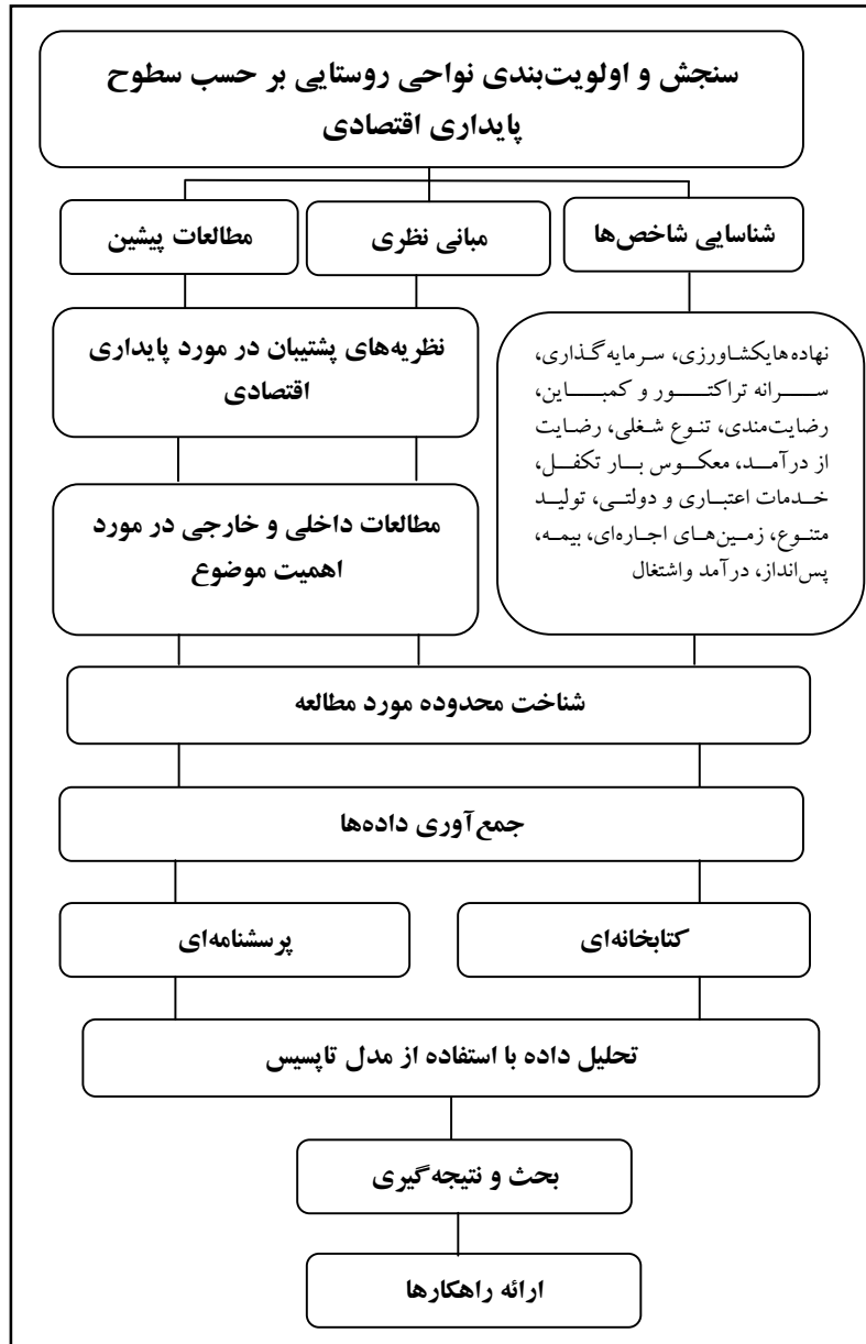
شکل ۱- مدل مفهومی پژوهش