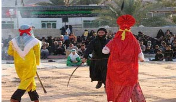
شکل شماره ۱: تعزیه در استان بوشهر

گفتنی است که ایران شاید تنها کشوری در میان مسلمانان باشد که هنر نمایش را به تعالی رساند. به گونه‌ای که مراسم تعزیه شکل تکامل یافته آیین‌ها و مراسم سوگواری هم چون دسته‌گردانی، نوحه‌سرایی، نقالی و روضه‌خوانی می‌باشد.