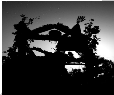
شکل شماره ۵: مراسم علم‌گردانی در منطقه بوشهر

مختک و تُویت (گهواره علی اصغر) مراسم دیگری است که در منطقه بوشهر اجرا می‌شود. بدین صورت که در روز عاشورا گهواره‌ای چوبی می‌سازند و پس از قراردادن طفلی در آن (در گذشته عروسک و امروزه از طفل صغیر و نوزاد استفاده می‌کنند)، آن را در منازل می‌چرخانند؛ به طوری که به صاحب مختک و کسی که گهواره را می‌چرخاند پولی داده می‌شود و مردم نیز برای افزایش طول عمر بچه‌های خود نذر می‌کنند و وجه نقدی به صاحب مختک می‌پردازند. گفتنی است زنان نیز گاه برای حفظ سلامتی خود و خانواده‌شان از زیر گهواره رد می‌شوند. اگرچه در منطقه زابل هیچ یک از این رسوم در برگزاری آیین گهواره علی اصغر اجرا نمی‌شود. لازم به ذکر است در روز عاشورا پس از پایان مراسم عاشورا، مراسم شبیه اصغر را اجرا می‌کنند. ولی امروزه