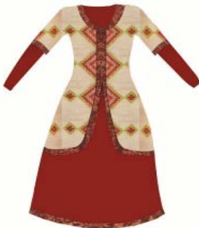
تصویر شماره ۵

انتخاب پارچه، رنگ و تزئین‌های مربوط به طرح مانتو