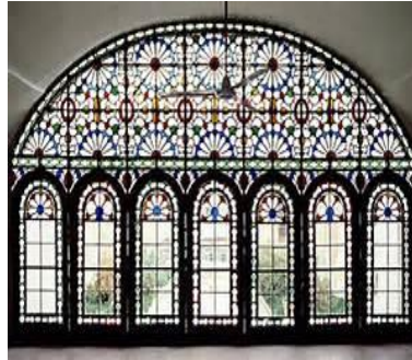
تصویر ۴- نمونه درب ارسی یکی از خانه‌های عهد قاجار یزد