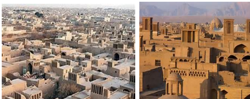
تصویر ۱- نمایش بخشی از بافت تاریخی شهر یزد متعلق به عهد قاجار (نمای از دید پرنده)

بدنه معابر و جهت حرکت خورشید و محاسبات تنظیم شرایط محیطی، آسان و خوشایند بوده است. از طرفی با تشکیل سایه‌روشن‌های زیبا با این عناصر، سیما و منظر شهری و پرسپکتیوهای زیبایی برای رهگذر خلق شده است (تصویر ۳). مناظر و سیمای شهری از دیگر مؤلفه‌های هویت کالبدی یزد بوده و مورد اشاره جکسون است.