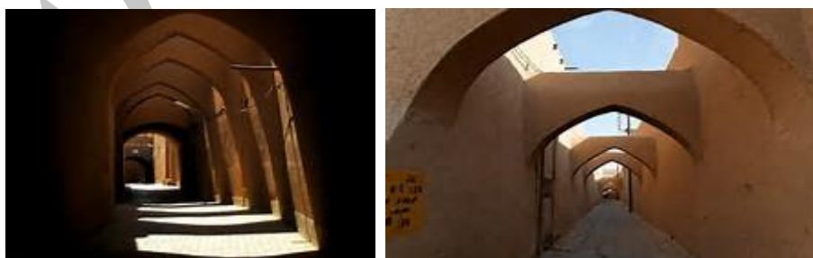
تصویر ۳- نمایش سایاطها و کوچه‌های سرپوشیده شهر یزد در عهد قاجار