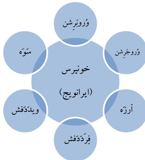
شکل شماره ۱: تقسیم‌بندی جهان براساس بندهش

تقدس و محوریت داشتن جغرافیای ایران در ذهنیت ایرانیان دوره ساسانی، در بندهش نیز انعکاس یافته است. در این کتاب، «خونیرس» به‌عنوان سرزمینی که «همه‌گونه نیکی در آن بیش آفریده شد»، در وسط و قلب جهان قرار دارد و شش سرزمین دیگر در پیرامون آن هستند. خونیرس به‌تنهایی برابر با شش اقلیم دیگر است و «ایرانویج» - جایگاه ایرانیان - در مرکز آن قرار دارد (نگاه کنید به شکل ۱). بنابر بندهش، همه نیکی‌ها ابتدا از خونیرس منشأ می‌گیرد، به‌طوری‌که «باد، نخست، ازین کشور خونیرس به شتاب به ارزه و سوه بگردد و از آنجا به شتاب به کشور فرَدَدَفَش و ویدَدَفَش گردد و از آنجا به شتاب به کشور خونیرس گردد». هم‌چنین، از هریک از شهرهای ایران با عنوان «بهترین سرزمین آفریده شده» یاد می‌شود. (فرنیغ‌دادگی، ۱۳۷۱: ۷۰، ۷۱، ۹۴، ۱۳۳)