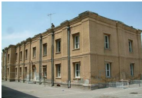
تصویر شماره ۸: ساختمان دبیرستان توحید تبریز

دبیرستان توحید یکی از قدیمی‌ترین دبیرستان‌های شهر تبریز است که در خیابان شریعتی قرار دارد و قدمت آن به دوران پهلوی اول می‌رسد. معماری دوران پهلوی کاملاً در ساختمان مدرسه مشهود است. بنا شامل سه طبقه، زیر زمین، همکف و اول و نیز سه ورودی در شمال و جنوب و غرب ساختمان است.