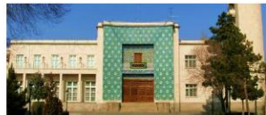
ساختمان استانداری که اکنون تبدیل به موزه شده است