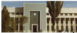
بانک ملی تبریز (شعبه مرکزی) که در دوره پهلوی دوم ساخته و به مجموعه اضافه گردید.