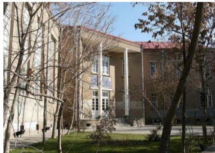
تصویر شماره ۷: ساختمان دانشسرای عالی تبریز

عملیات ساخت ساختمان دانشسرای عالی تبریز در سال ۱۳۱۵ خورشیدی در محل سربازخانه و میدان مشق تبریز شروع شده و در سال ۱۳۱۸ خورشیدی پایان پذیرفت. گفته می‌شود در ساختمان بنای دانشسرای مقدماتی پسران تبریز، مهندسان آلمانی نیز با معماران ایرانی همکاری فنی داشته‌اند هم‌چنین این مکان به‌عنوان اولین دانشگاه تبریز فعالیت می‌کرد.