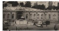
عمارت شهرانی که در دوره پهلوی دوم تخریب شد.