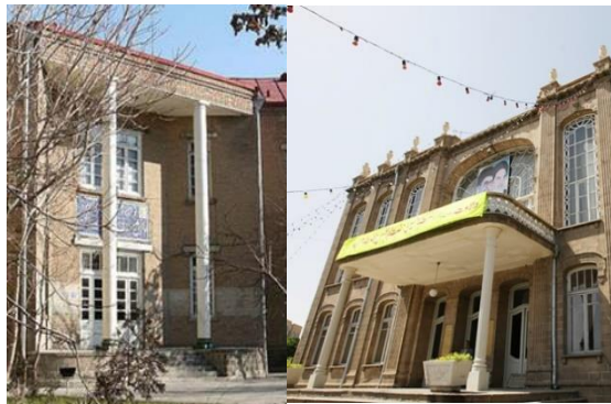
تصویر شماره ۹: ورودی بناهای حکومتی و دولتی اغلب به صورت بیرون زده و شاخص