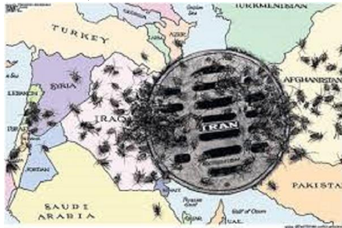
اثر مصور شماره ۱۰: سرچاه تروریسم!