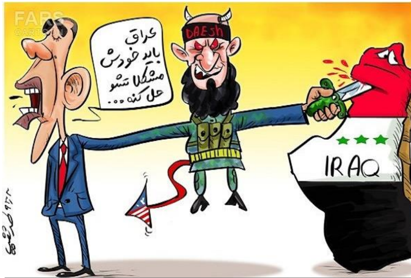
اثر مصور شماره ۱۵: به نیابت از شیطان!