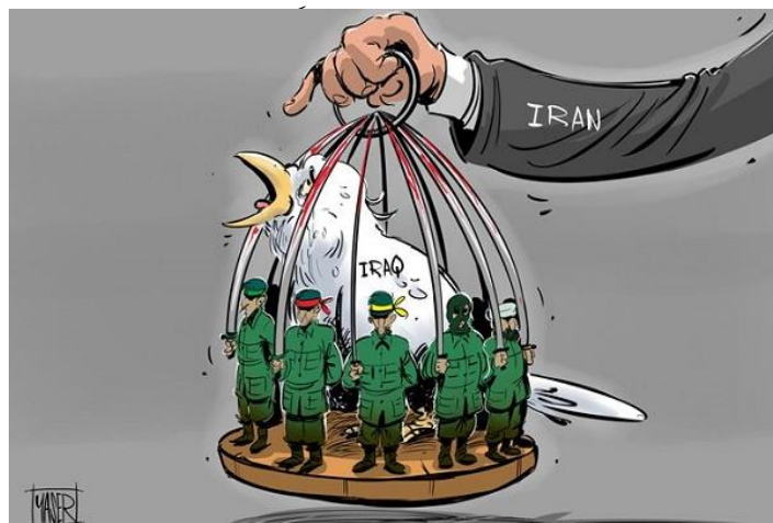
اثر مصور شماره ۹: عراق در بند!