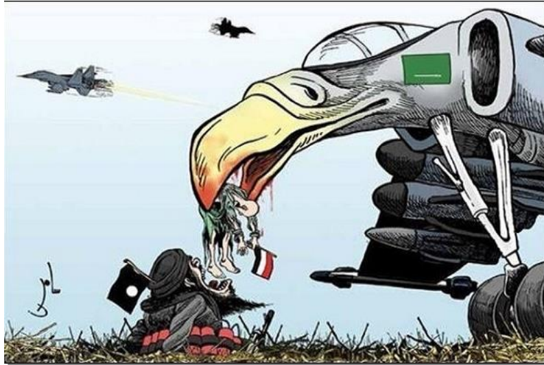
اثر مصور شماری ۴: مادر تروریست‌ها!

در این تصویر، پس‌زمینه‌ای از پرواز هواپیماهای جنگنده، در قالب نشانه نمایه‌ای از بروز شرایط جنگی حکایت دارد و در نمای نزدیکتر، یک هواپیمای جنگنده که به جای دماغه، منقاری شبیه کرکس دارد به چشم می‌خورد. این موجود عجیب‌الخلقه که معادل نمادین حیوانات لاشه‌خوار است، با پرچم سبز رنگ عربستان، اشاره‌ای نمادین به ماهیت وحشی و درنده‌خویی رژیم سعودی است. این موجود عجیب‌الخلقه درحالی‌که خون از منقارش جاری است و در قالب نمایه، وقوع جنایت را بازنمایی می‌کند، کودکی که نماد معصومیت و بی‌گناهی است را درحالی‌که پرچم یمن را در قالب نماد این سرزمین در دست دارد، به مسلخ لانه خود می‌برد. لانه‌ای که به جای جوجه، شخصیتی سیاه‌پوش، با جلیقه انفجاری و سلاح و پرچمی سیاه‌رنگ، به‌منزله‌ی نماد گروه‌های تروریستی و