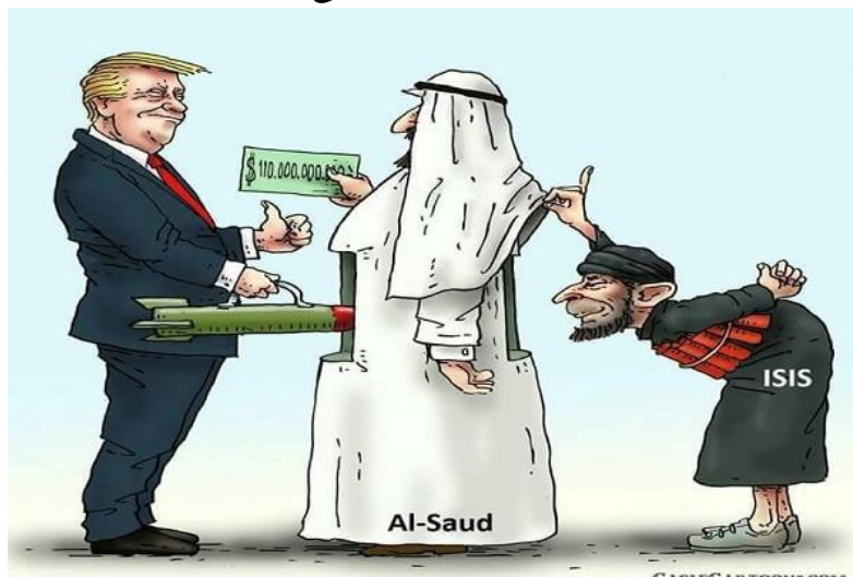
اثر مصور شماره ۲: پول برای امریکا، سلاح برای تروریست‌ها...