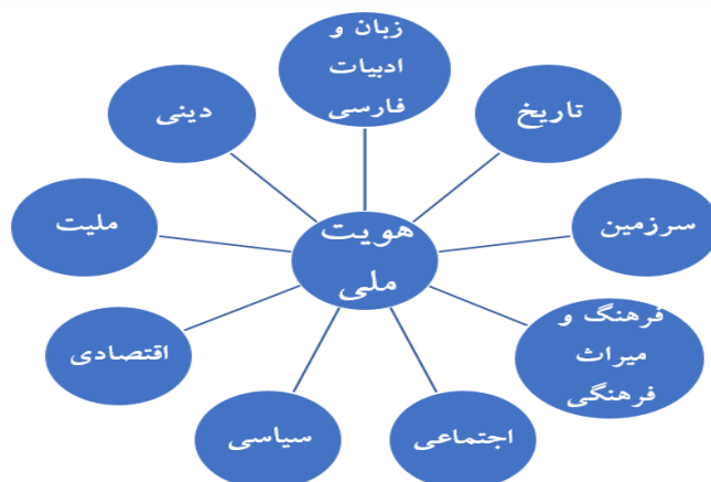
شکل شماره ۱: هویت ملی و ابعاد آن

هویت ملی در وهله نخست زاینده محیط جغرافیایی هر ملت است؛ محیط جغرافیایی تبلور فیزیکی، عینی، ملموس و مشهود هویت ملی به حساب آمده و دل‌بستگی و تعلق خاطر به سرزمین مادری که با مرزهای معین، مشخص می‌شود (گنجی، ۱۳۷۸: ۶۸). برای شکل‌گیری هویت واحد ملی، تعیین محدوده و قلمرو یک سرزمین مشخص، ضرورت تام دارد (ملکی و همکاران، ۱۳۹۵: ۶۹).