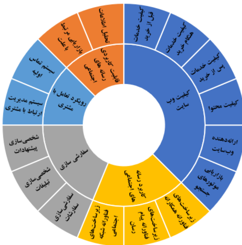
شکل ۲- چارچوب مفهومی سازه‌ها و مؤلفه‌های مؤثر بر بهبود ارتباط با مشتری در کسب‌وکار الکترونیکی