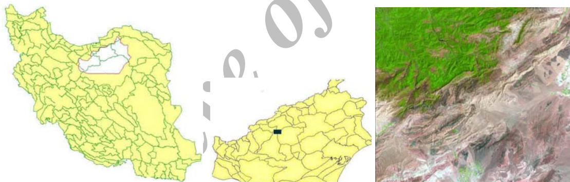
شکل ۱- موقعیت محل اجرای آزمایش جنگلکاری با گردو در استان سمنان روی نقشه و تصویر ماهواره ای

منطقه از نظر زمین‌شناختی بر روی سازند شمشک و آبرفت‌های کواترنر واقع شده است. سازند شمشک اغلب از شیل و ماسه‌سنگ تشکیل شده است. تیپ خاک به طور