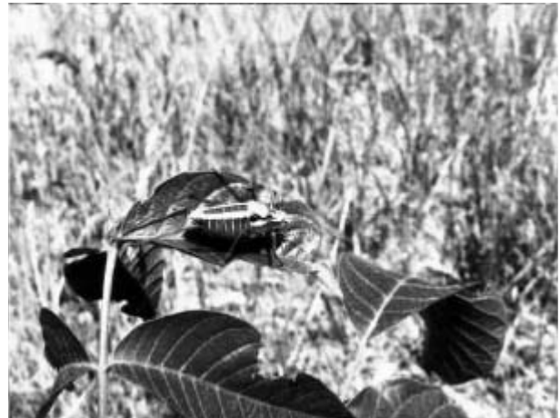
شکل ۳- حمله و صدمه نوعی ملخ شاخک بلند از خانواده Tetrigonidae به جوانه‌های تازه نهالهای گردو