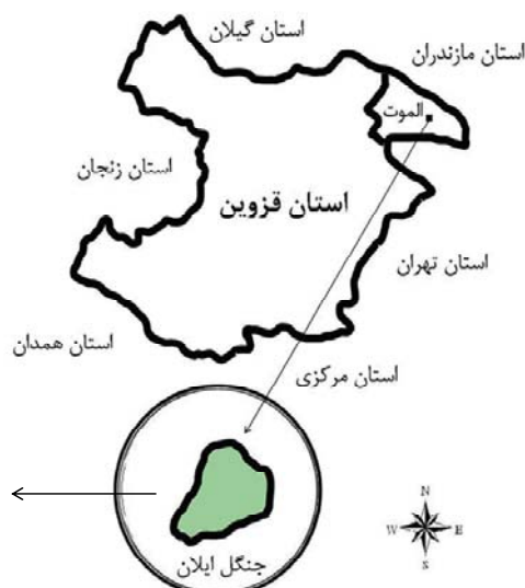
شکل ۱- نمایی از موقعیت رویشگاه ارس ایلان