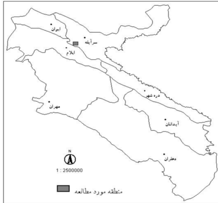
شکل ۱- موقعیت منطقه مورد مطالعه بر روی نقشه استان ایلام

بارندگی سالیانه ۵۹۵ میلی متر و متوسط درجه حرارت سالیانه آن ۱۶/۹ درجه سانتی گراد است. به طوری که فصل