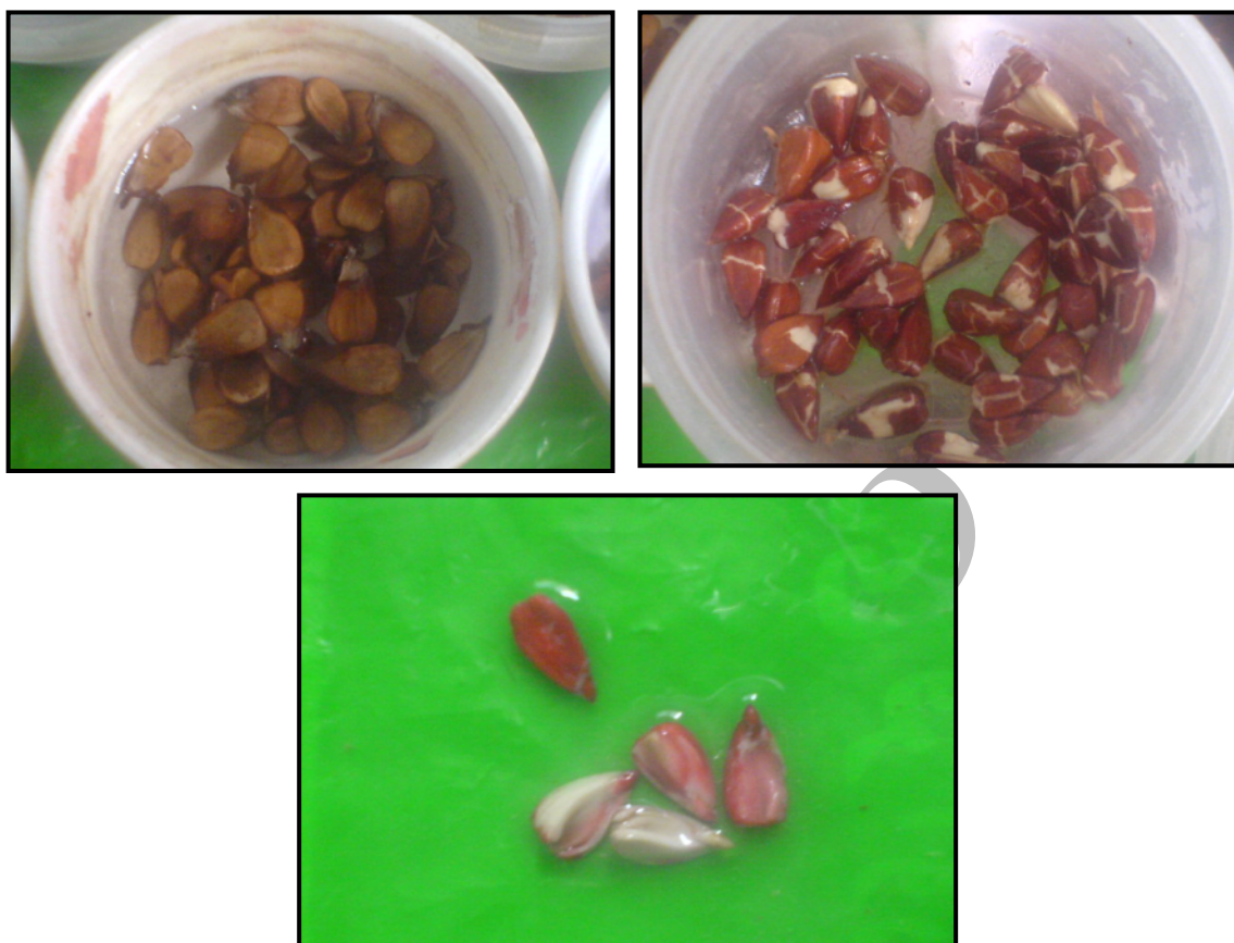
شکل ۱- بالا سمت چپ: بذرهای خیس‌انده شده در آب برای کندن پوسته اول؛ بالا سمت راست: بذرهای خیس‌انده برای کندن پوسته دوم؛ پایین: بذر سالم (۴ عدد) و ناسالم (۱ عدد) آغشته به محلول تترازولیوم ۱٪