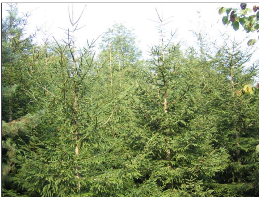
شکل ۲- گونه نوئل ( Picea abies ) در منطقه میان‌بند نوشهر