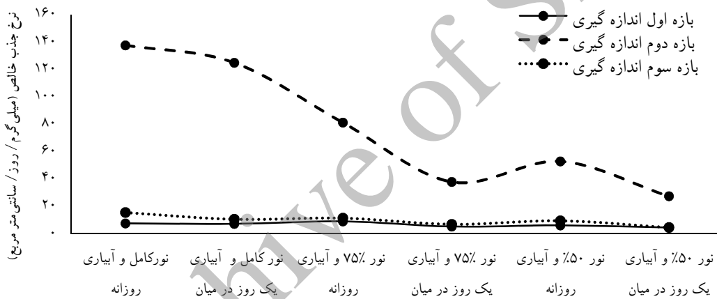
شکل ۱- روند تغییرات نرخ جذب خالص

میانگین‌های دارای حروف نامشابه برای هر مشخصه نشان‌دهنده تفاوت معنی‌دار آماری بین بازه‌های زمانی است.