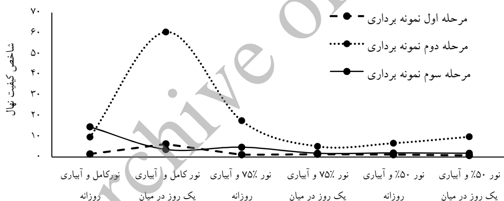
شکل ۳- روند تغییرات شاخص کیفیت نونهال

میانگین‌های دارای حروف انگلیسی مشابه در هر ستون از نظر آماری در سطح اطمینان ۹۵ درصد دارای اختلاف معنی‌دار نیستند.