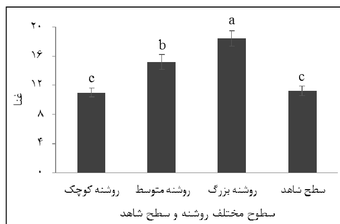
شکل ۳- میانگین شاخص تنوع غنا گونه‌ای در منطقه مورد مطالعه (حروف کوچک متفاوت نشان‌دهنده وجود تفاوت معنی‌دار در سطح اطمینان ۹۵ درصد است).

غنا گونه‌ای با افزایش مساحت روشنه افزایش معنی‌داری را نشان داد. نتایج آزمون مقایسه میانگین‌ها نشان داد که مقادیر غنا گونه‌ای در روشنه‌های متوسط و بزرگ