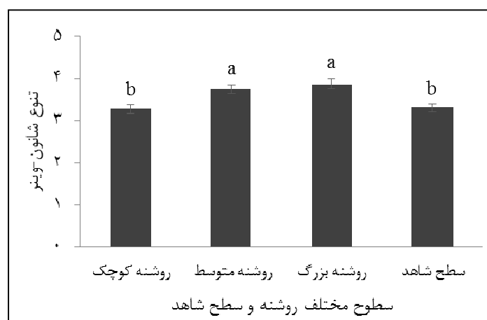
شکل ۲- میانگین شاخص تنوع شاخون-ویتر در منطقه مورد مطالعه (حروف کوچک متفاوت نشان‌دهنده وجود تفاوت معنی‌دار در سطح اطمینان ۹۵ درصد است).

بزرگ با یکدیگر اختلاف معنی‌داری نداشت، اما با سطح کوچک روشنه و سطح شاهد دارای اختلاف معنی‌دار بود.