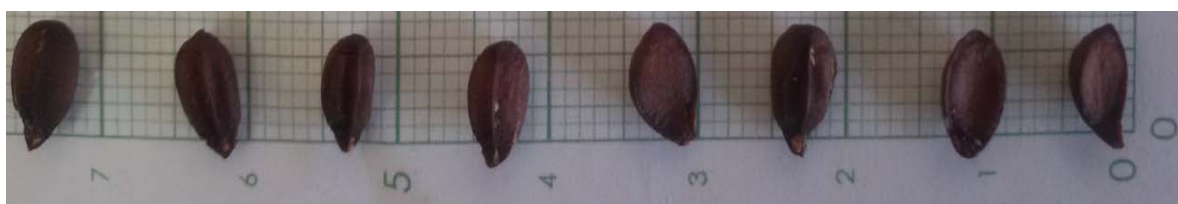
شکل ۲- بذر بارانک ایرانی