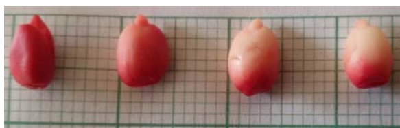
شکل ۳- رنگ‌پذیری بذرهای بارانک ایرانی در آزمون تترازولیوم، از چپ: بذرهای اول و دوم زنده، سوم و چهارم نیمه‌زنده