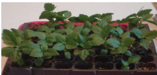
شکل ۴- جوانه‌زنی و سبز شدن بذر در ژرمیناتور

هوایی (۶/۵ سانتی‌متر) و ریشه‌چه (۶/۴ سانتی‌متر) مربوط به تیمار شاهد بود که از نظر طول ریشه‌چه اختلاف معنی‌داری با تیمارهای T_1, T_2, T_3, T_6, T_{10} و T_{nt} نداشت (جدول ۴).