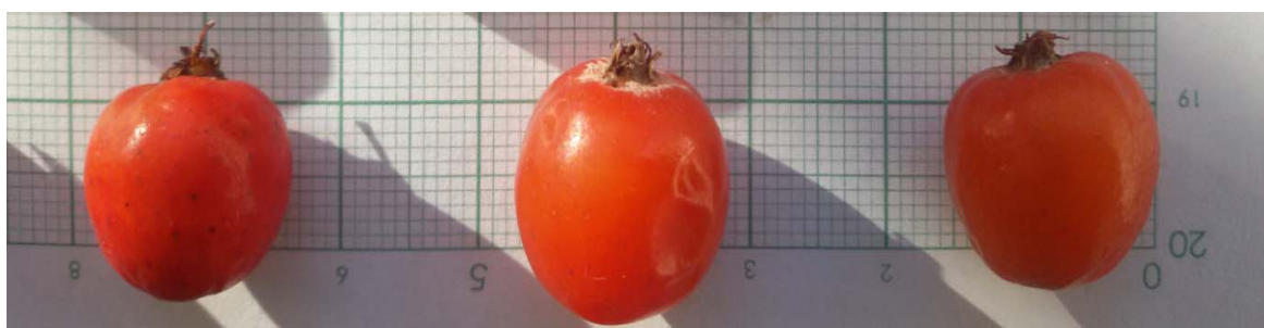
شکل ۱- میوه بارانک ایرانی

آزمون تعیین درصد زنده‌مانی بذرها: یک ماه و دو سال پس از برداشت، زنده‌مانی بذرها با چهار تکرار ۲۰ تایی با استفاده از آزمایش تترازولیوم تعیین شد. ابتدا بذرها به مدت ۶ ساعت در آب با دمای ۲۰ درجه سانتی‌گراد خیسانده شدند و سپس برش عرضی بذرها در فاصله یک میلی‌متری سمت مخالف نوک باریک بذر به منظور نفوذ بیشتر محلول تترازولیوم و رنگ‌پذیری بهتر بذر ایجاد شد. بذرها به مدت ۱۸ ساعت در محلول تری‌فنیل تترازولیوم کلراید یک درصد با دمای ۳۰ درجه سانتی‌گراد قرار گرفته و پس از خروج از محلول و آبکشی، مکان و درصد رنگ‌پذیری هر یک از بذرها بررسی شد. بذرهای با رنگ‌پذیری قرمز تا صورتی در حاشیه‌های جنین و لپه‌ها، به‌عنوان بذر با جنین زنده تلقی شدند (Moore, 1985; Anonymous, 1999; Anonymous, 2000).