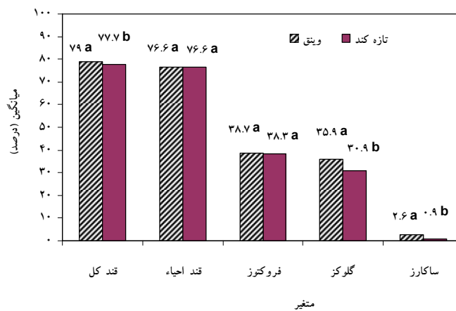
شکل ۳- مقایسه محتوای قندهای اصلی نمونه‌های عسل مناطق مورد مطالعه

از نظر قند کل ( p = ۰/۰۴ ) و قندهای ساکارز ( p = ۰/۰۱۶ ) و گلوکز ( p = ۰/۰۳۸ ) اختلاف معنی‌داری بین عسل‌های دو منطقه وجود داشت (شکل ۳). میانگین نسبت فروکتوز به گلوکز در تازه‌کند و وینق به ترتیب ۱/۲۴ و ۱/۰۸ به دست آمد. میزان فروکتوز در تمام نمونه‌های عسل بیشتر از گلوکز بود و میانگین نسبت فروکتوز به گلوکز