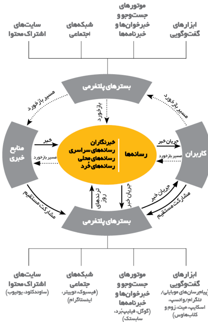
شکل ۳. اکوسیستم خبر پلتفرمی شده

این بسترهای پلتفرمی امکان حضور برابر میان تولیدمصرف‌کنندگان شخصی و تجاری محتوا را در کنار رسانه‌های خبری فراهم می‌کنند و بسیاری از منابع خبری را به تولیدکنندگان محتوا (و در حقیقت به تولیدکنندگان جریان ارزش در پلتفرم) تبدیل کرده‌اند (شکل شماره ۲ این جریان را به خوبی تصویر کرده است). همچنین درهم‌آمیختگی این بسترهای پلتفرمی با عملکرد سازمان‌های رسانه‌ای سبب شده است تا چالش‌هایی گسترده درباره ارزش‌های