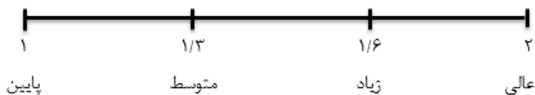
شکل ۳- شدت اهمیت (رتبه) برای گویه های ضعف و تهدید

رتبه نقاط ضعف و تهدیدها نیز طیفی چهار سطحی از یک تا دو است که از خیلی شدید تا خیلی کم نمره گذاری شدند.