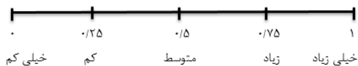
شکل ۱- ضریب اهمیت برای گویه‌های قوت، ضعف، فرصت و تهدید

ضریب اهمیت نشان‌دهنده اهمیت نسبی یک عامل در میان سایر عوامل است. این ضریب در طیفی پنج سطحی از صفر تا یک مشخص می‌شود.