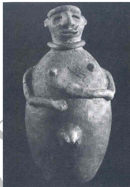
تصویر ۱- مجسمه نشان‌دهنده فتق نافی (قرن پنجم و چهارم قبل از میلاد)

Paul of Aegina در سال ۷۰۰ میلادی آخرین نویسنده کتب کلاسیک یونانی، تفاوت بین هرنی اینگوینال ناکامل ( Bubonocoele ) را با نوع کامل ( Scrotal ) بیان کرد. همچنین او نظریه پارگی پریتون را رد کرده و اعتقاد داشت که پریتون در اثر کش آمدن (تشکیل ساک)، منجر به ایجاد فتق می‌گردد.