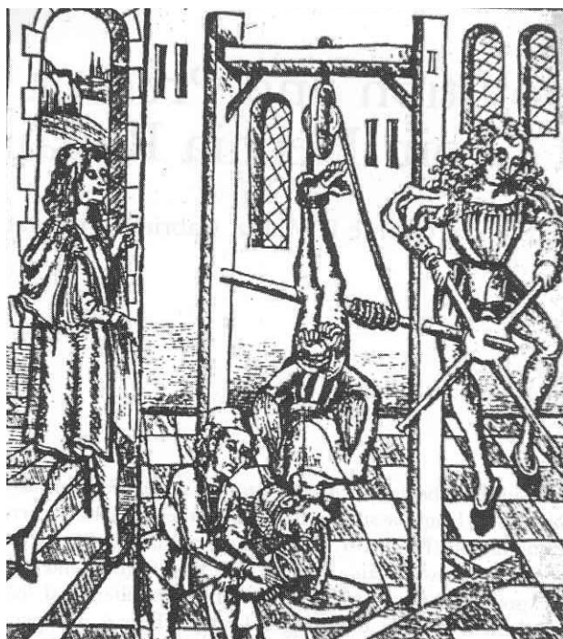
تصویر ۳- درمان فتق گیر کرده در روزگار باستان

ایجاد فتق، بدون اینکه از علم تشریح بهره‌ای برده باشد، ارائه کرد، این نظریه تا زمانی که جراحان از آناتومی اطلاع یافتند پابرجا ماند.