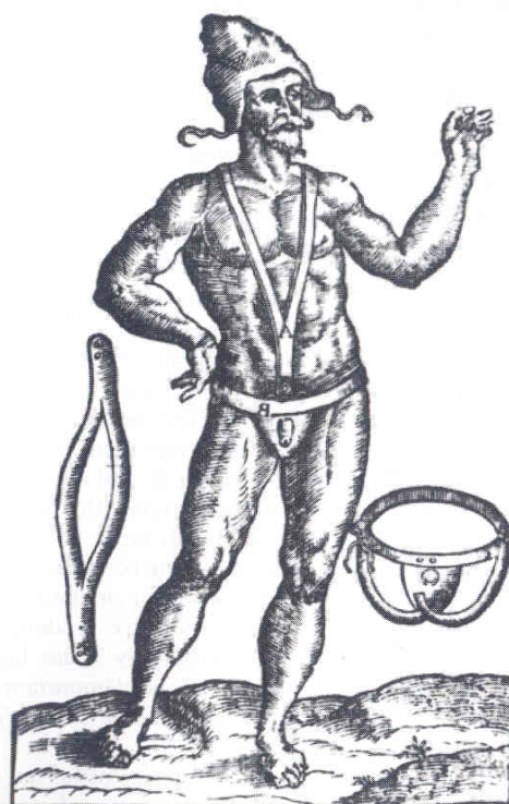
تصویر ۲- فتق بند برای فتق مقبلی

Guy de chauliac پزشک فرانسوی (۱۳۶۳ میلادی) در کتابی که در جراحی به رشته تحریر درآورد به نام Chirurgia Magna برای اولین بار تفاوت بین فتق مستقیم و غیرمستقیم را توضیح داد و انجام عمل جراحی را برای فتق خطرناک و مورد تردید قرار می‌دهد. او همانند Albucasis