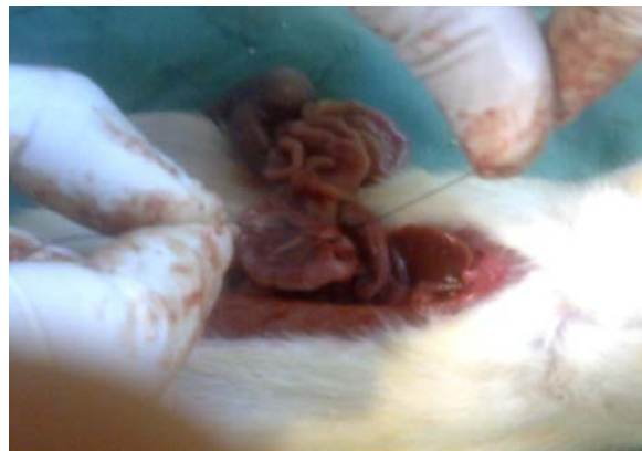
تصویر ۲- مرحله لیگاتور شریان مزانتریک فوقانی در رت مورد مطالعه

همانگونه که در جدول بالا دیده می‌شود در گروه رت‌هایی که لاپاراتومی شدند و عروق مزانتریک فوقانی در آنها لیگاتور شد و سطح دی دایمر سرم یک ساعت پس از لیگاتور گرفته شد (گروه ۲) نسبت گروهی که تنها لاپاراتومی شدند و نمونه