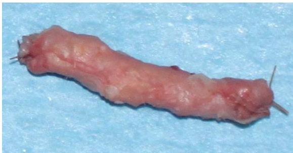
تصویر ۲- گرافت غضروفی خرد شده پیچیده شده در فاشیا آماده برای پیوند

بعد از ۱۲ هفته خرگوش‌ها به طور استاندارد و با استفاده از نسدونال و گاز دی اکسید کربن کشته شدند. با دادن برش در خط وسط (جهت اجتناب از اسکار عمل اول) غضروف پیوندی پیدا شد و تحت بزرگنمایی با لوپ ۴/۳ برابر از نظر چسبندگی به اطراف ارزیابی گردید و با دقت از بافت‌های اطراف جدا و خارج گردید (تصویر ۳). غضروف جدا شده عکس‌برداری انجام شد و وزن آنها اندازه‌گیری شد و اطلاعات در فرم مربوطه ثبت شد. نمونه‌ها در محلول فرمالین ۱۰ درصد فیکس شد و جهت بررسی پاتولوژی فرستاده شد. در ادامه نمونه‌ها برش داده شده و رنگ‌آمیزی به روش هماتوکسیلین و ائوزین (H & E) انجام شد و نمونه‌ها از نظر وجود غضروف تام، کندروسیت‌های زنده، غضروف جدید، فیبروز، استخوانی شدن، توسط پاتولوژیست مورد بررسی قرار گرفت (تصاویر ۴ و ۵).