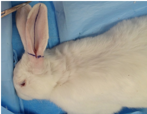
تصویر ۱- علامت‌گذاری محل آمپوتاسیون گوش خرگوش