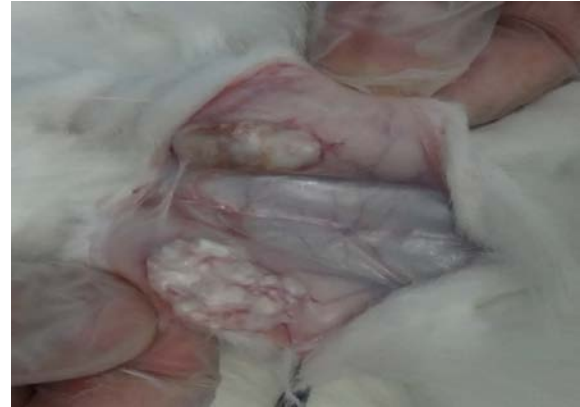
تصویر ۳- گرافت‌های غضروفی در هنگام دیسکسیون و قبل از خارج کردن کامل در پشت خرگوش

از ۱۵ خرگوش مورد مطالعه ۳ مورد (۲۰ درصد) در حین مطالعه فوت شدند و از مطالعه خارج شدند. یکی از آنها جهت اتوپسی فرستاده شد که انسداد خروجی معده به علت تریکوبیزوار (Trichobezoar) عامل مرگ تشخیص داده شد. همچنین سه مورد باز شدن بخیه (Dehiscence) محل برداشتن فاشیا رخ داد که مجدداً ترمیم شد. عفونت در محل قرار دادن غضروف‌ها مشاهده نشد.