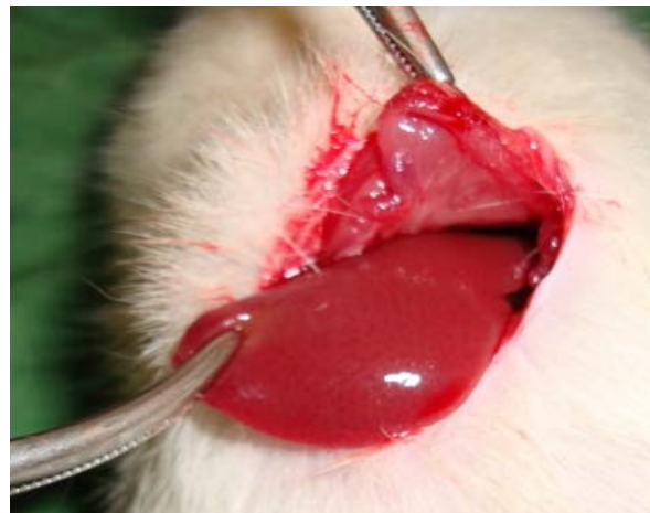
تصویر ۱- برش در پوست و زیر جلد برای دسترسی به کوب کبدی در حفره شکمی موش نروستار

به فاصله ۰/۵ سانتی‌متر از نوک قرار داده شد تا بتوان عمق یکسانی را برش داد و برای برش با طول یکسان از یک خط کش استفاده شد و برشی به طول ۲ سانتی‌متر و عمق ۰/۵ سانتی‌متر روی کبد داده شد.