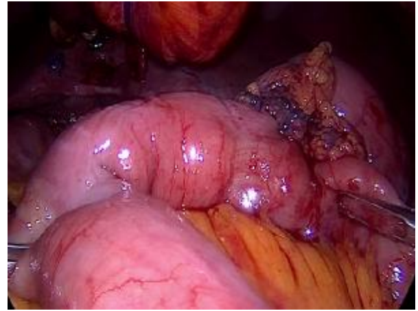
تصویر 3 - آناستوموز معده به ژژنوم بصورت آتته کولیک

در بین جراحی‌های پیچیده لاپاروسکوپی که در ایران صورت می‌گیرد جای خالی این شیوه احساس می‌شد. با توجه به درد کم بیمار بعد از جراحی، بهبودی سریعتر و کم‌تهاجمی بودن، با در نظر گرفتن جمیع جهات و کسب مهارت لازم و فراهم کردن تمامی ابزار لازم، این روش توصیه می‌شود. البته برای نتیجه‌گیری دقیق‌تر مطالعات مقایسه‌ای و مداخله‌ای بالینی ضروری است.