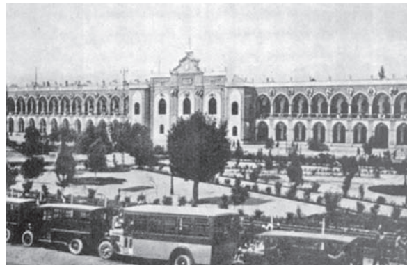
ت۲. (راست) ساختمان بلدیة. مأخذ: Tehran: Un Urban Analysis ت۳. (چپ) ساختمان ایستگاه راه آهن. مأخذ: Tehran: Un Urban Analysis

انگارهٔ ایجاد هماهنگی در نماهای شهری و آراستن چهرهٔ شهر به معماری نو همزمان با ایجاد تغییرات در بلدیة تهران در دستور کار قرار می‌گیرد. در سال ۱۳۰۶، به تقاضای بلدیة، طاهرزادهٔ بهزاد مقررات و نظام‌نامهٔ کلی برای ابنیة تهران را تهیه می‌کند. ۱۸ در سال ۱۳۱۸ نیز «قانون آیین‌نامهٔ پیش‌آمدگی در گذرها» از تصویب می‌گذرد.