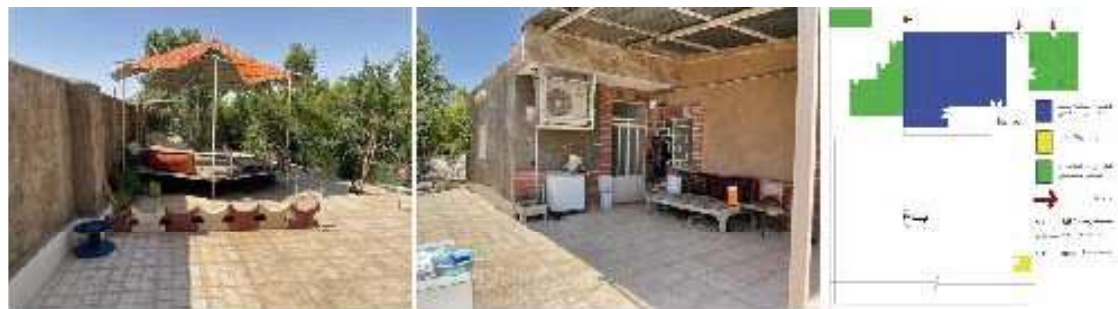
ت ۱ (بالا). پلان و تصاویری از فضای حیاط در مسکن روستایی سنتی، عکس‌ها: نیاز عظیمی، نقشه و تدوین: نگارندگان.