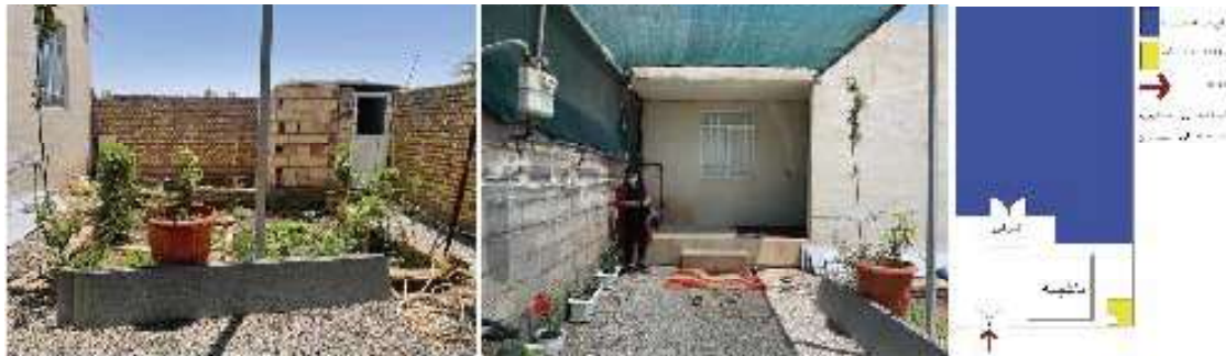
۳۵. نک: شیخ‌طاهری، طراحی خانه روستایی.

در پژوهش حاضر پس از دسته‌بندی ویژگی‌های حیاط و شناسایی وجوه اصلی آنها با عنوان متغیرهای مستقل و سه گروه خانه‌های روستایی سنتی، بازسازی‌شده، و معاصر با عنوان متغیر وابسته به تحلیل هر یک در بخش یافته‌های پژوهش پرداخته می‌شود.