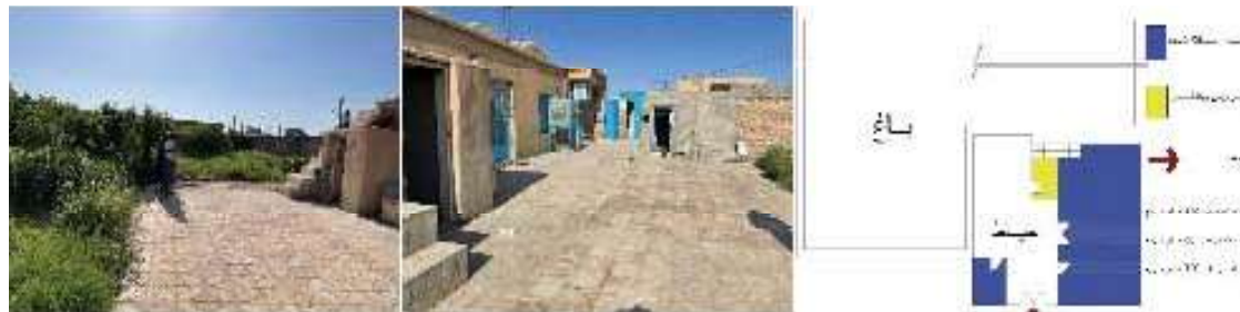
۳۳. نک: زرگر و حاتمی خانقاهی، همان.

و اشرافیت به فضای زندگی روستاییان، جایگاه اجتماعی افراد و ارتباط آن با تعدد حیاط (اندورنی، بیرونی)، تغییر الگوی زندگی از گسترده به هسته‌ای، و تبدیل دانه‌های درشت خانه در بافت روستایی به دانه‌های ریزتر و در نتیجه ریزتر شدن حیاط‌ها در کارایی آن مؤثر بوده است. همچنین مذهب و تأثیر آن بر جهت قرارگیری خانه، کاربرد اشکال و فرم‌های مذهبی در معماری فضاهای باز حیاط و عناصر آن، حفاظت از حریم خصوصی خانه و سلسله‌مراتب حضور در حیاط، توجه به ارزش‌های تاریخی، برخی رفتارهای قراردادی مؤثر در فرم و ابعاد حیاط، ایوان، و... از ریشه‌های فرهنگی و مذهبی در مناطق مختلف نشئت می‌گیرند. از دیدگاه زیست‌محیطی نیز نقش حیاط در هماهنگی میان طراحی مسکن با محیط اطراف و ایجاد کمترین تغییرات در محیط طبیعی مؤثر است. همچنین شرایط اقلیمی (دما، رطوبت، بارش، تابش، نور، شکل زمین، و...)، جزئیات اجرایی تعیین‌کننده نحوه شکل‌گیری، فرم، تناسبات فضاهای باز و