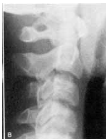
مرحله ی تکامل