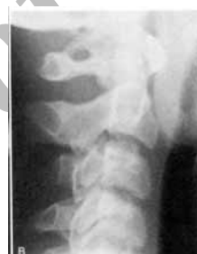
مرحله ی کاهش شتاب