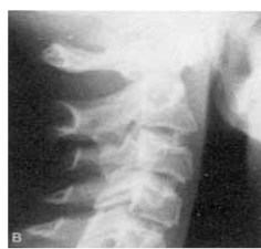
مرحله ی انتقال