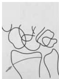
پیوند اپی فیز و دیافیز