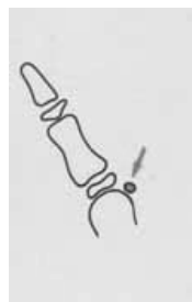
استخوانی شدن سساموئید