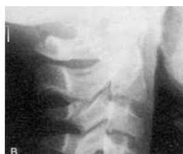
مرحله ی شتاب