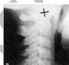
مرحله ی آغازین