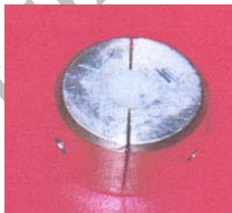
نگاره ی ۱: مولد برنجی با دیسک کامپوزیت

برای مقایسه ی میانگین سختی ویکرز (VHN) در گروه های گوناگون از سه آزمون آماری تحلیل واریانس یک سویه و آزمون شفه (Scheffe) استفاده شد ( \alpha < 0/05 ).