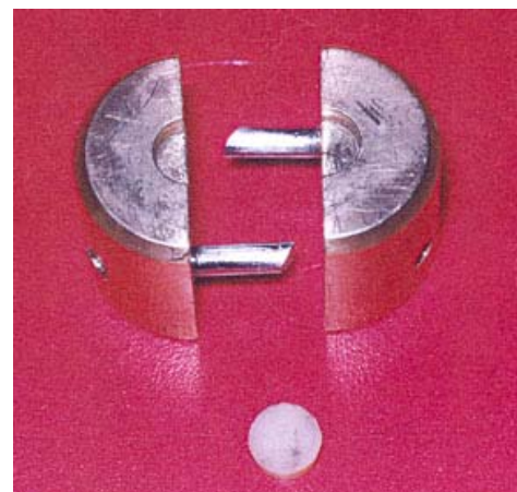
نگاره ی ۲: مولد برنجی و دیسک کامپوزیتی خارج شده از مولد