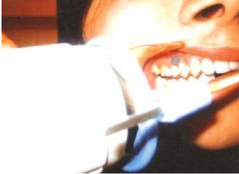
نگاره‌ی 1: موقعیت بیمار و تنظیم تیوب دستگاه

دندان‌های خود را بر روی هم قرار دهد. لوله‌ی دستگاه پرتونگاری موازی با میله و مماس با رینگ فیلم نگهدار XCP تنظیم شود (نگاره‌ی 1).