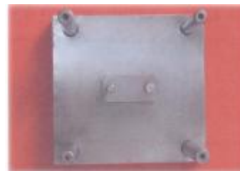
نگاره ی 8: بخش پایینی الگوی آزمایشگاهی شامل دای ها، صفحه ی پایینی، بیس فلزی و میله های راهنما