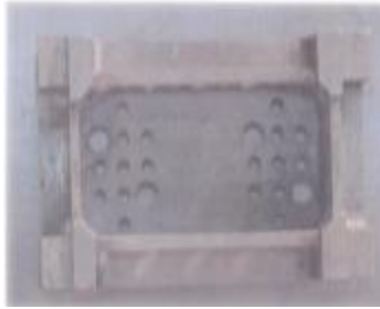
نگاره ی 4: تری قالبگیری