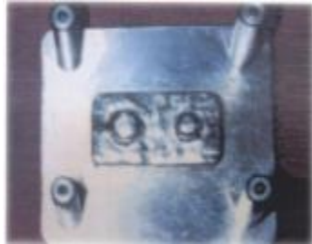
نگاره ی 5: فاصله گر فلزی و قرار گیری آن بر روی دای ها