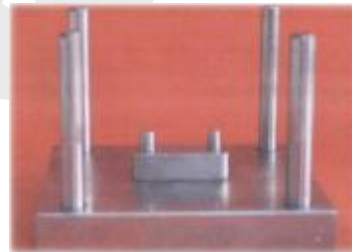
نگاره ی 7: دای با اندرکات و بی اندرکات بر روی بیس فلزی

ترتیب بود، که گچ به آهستگی (10 ثانیه) به درون آب ریخته شده و سپس، 30 ثانیه صبر کرده تا گچ، آب را به درون خود بکشد، پس از آن، گچ آماده شده در مدت سه دقیقه با ارتعاش کم (Light vibration) به درون قالب ریخته، پس از یک ساعت، کست گچی از آن بیرون آورده می شد. زمان های گفته شده بر پایه ی دستور کارخانه ی سازنده و روش قالبگیری از گونه با فضا بود. از آنجا، که فضای مناسب برای ماده ی واش، 1/5 میلی متر است، بنابراین با استفاده از یک فاصله گر (spacer)، با ضخامت 1/5 میلی متر قالب پوتی فراهم گردید. در مرحله ی دوم، فاصله گر برداشته، واش داده شد. در این روش، کمترین میزان تغییرات ابعادی، به دلیل بودن فضای کافی برای واش و جلوگیری از وارد شدن فشار به ماده ی پوتی وجود دارد (نگاره ی 5).