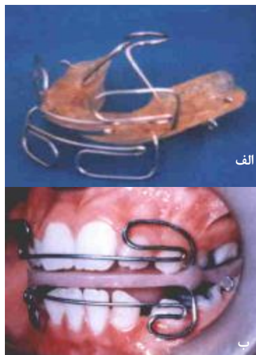
نگاره 1: الف: دستگاه فانکشنال فرمند، ب: دستگاه فانکشنال در دهان بیمار

مال اکلوژن کلاس دو گروه یک انجام گرفته و بیماران به طور میانگین 11 ماه با دستگاه فانکشنال فرمند درمان شدند. دستگاه فرمند 2 (Fa II) مورد استفاده در این پژوهش به وسیله‌ی دکتر مهدی فرمند در سال 1972 طراحی و معرفی و در دانشگاه لویولای امریکا، به نام مهدی فرمند ثبت گردیده است (نگاره‌ی 1). این دستگاه، گونه‌ی دستگاه توت بورن (Tooth- Borne) غیرفعال است و در مقایسه با دیگر دستگاه‌ها بسیار ظریف و سبک و با استفاده از حداقل اجزای سیمی و آکریلی ساخته می‌شود. دستگاه فرمند دو برای درمان مال اکلوژن کلاس دو به کار می‌رود و به وسیله‌ی بسیاری از متخصصان ارتودنسی و دندانپزشکان عمومی در ایران استفاده می‌شود (5) .