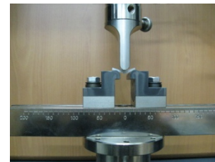
نگاره‌ی ۲ آزمون استحکام خمشی (Three point bending)

نمونه‌ها پیش از آزمایش استحکام خمشی به مدت ۲۴ ساعت در آب مقطر در دمای اتاق نگهداری گردیدند و سپس جهت اندازه‌گیری استحکام خمشی در دستگاه آزمایشی یونیورسال (Zwick/Roell Z020, Germany) با سرعت کراس هد ۱ میلی‌متر / دقیقه تحت آزمایش استحکام خمشی (Three point bending) قرار گرفتند (نگاره‌ی ۲). اندازه‌ی نوک تیغه در جای وارد کردن نیرو یک میلی‌متر بوده است.