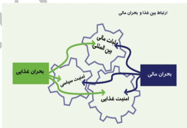
شکل شماره ۲. ارتباط بحران مالی با بحران غذایی

یکی از عمده‌ترین عواملی که همواره قیمت مواد غذایی را تحت تأثیر قرار داده است، مسئله احتکار بوده است. با بروز بحران مالی ایالات متحده در سال ۲۰۰۸، بسیاری از کسانی که سرمایه‌های خود را در بازار مسکن یا بازارهای دیگر سرمایه‌گذاری کرده بودند، آن را روانه بازارهای مواد خام نمودند. احتکار به معنی فرض ریسک از دست دادن سرمایه در عوض احتمال نامطمئن سود است. به طور عامیانه تعریف احتکار خرید کالا برای فروش و آزادسازی در آینده به جای مصرف در زمان کنونی است. احتکار کالا شامل خرید، نگهداری، فروش و خرید موقت سهام، اوراق بهادار، مواد خام یا هر ابزار مالی ارزشمند برای سود بردن از نوسانات قیمت آن در برابر خرید به قصد مصرف است. در چهارچوب بازار مواد غذایی، محتکران کسانی هستند که متحمل ریسک نسبی می‌شوند. احتکار مواد غذایی به عنوان یکی از عوامل مؤثر بر افزایش قیمت، نیاز به تنظیمات خاصی در سطح مؤسسات جهانی دارد که تا به حال مفقود بوده است. راه حلی جهانی برای جلوگیری از احتکارات بیشتر دربردارنده هزینه‌های بسیاری است، اما در مقایسه با زیان‌های افزایش قیمت نظیر آنچه در سال ۲۰۰۸-۲۰۰۷ اتفاق افتاد هنوز این سیاست بازدهی بیشتری خواهد داشت. (۱۲) نمودار ذیل ارتباط بحران غذایی را با بحران مالی اخیر نشان می‌دهد.