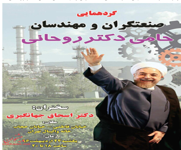
تصویر شماره (۷). آگهی «گردهمایی صنعتگران و مهندسان حامی دکتر روحانی»