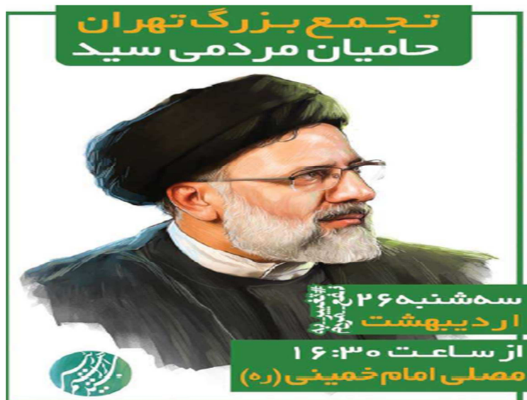
تصویر شماره (۴). آگهی «حامیان مردمی سید»