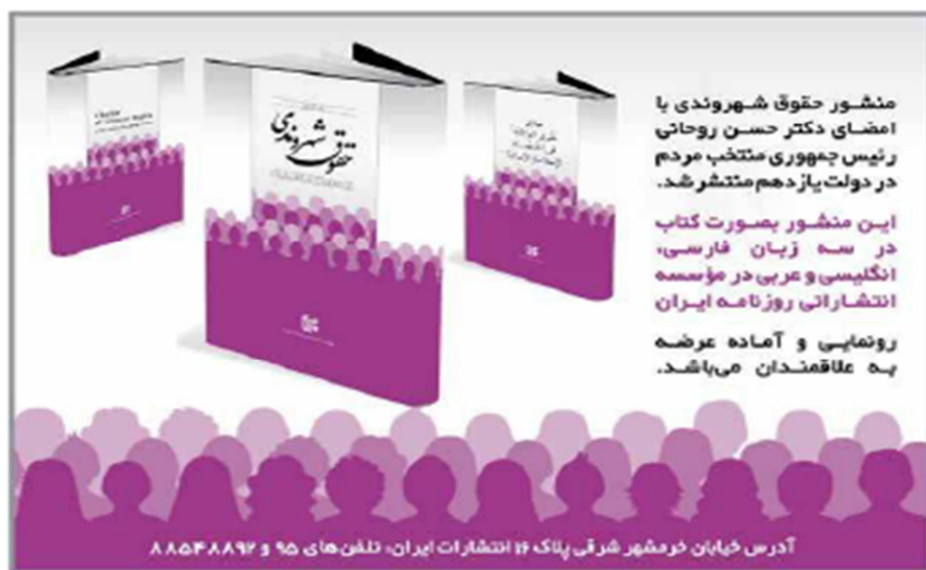
تصویر شماره (۶). آگهی «حقوق شهروندی»