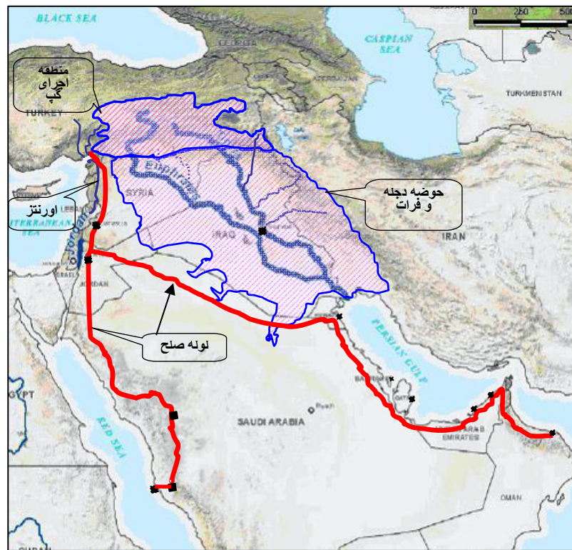
نقشه شماره ۳: حوضه دجله و فرات