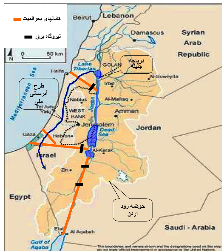
نقشه شماره ۲: حوضه رود اردن

طبق جدول شماره ۸ میانگین سرانه آب در کشورهای حوضه رود اردن در سال ۲۰۰۵ حدود ۵۳۵ مترمکعب در سال بوده است که در سال ۲۰۲۵ به ۴۲۸ مترمکعب کاهش خواهد یافت. بیشترین میزان سرانه آب در این حوضه مربوط به کشور لبنان و کمترین میزان مربوط به فلسطین است. در سال ۲۰۰۵ میزان سرانه آب اسرائیل حدود ۴ برابر فلسطینی‌ها بود که در سال ۲۰۲۵ این میزان به علت رشد زیاد جمعیت فلسطینی‌ها افزایش یافته و به حدود ۵ برابر خواهد رسید. با توجه به پیش‌بینی جمعیت ۲۷ میلیونی برای کشورهای حوضه رود اردن در سال ۲۰۲۵، فشار زیادی به منابع آب وارد خواهد شد و استخراج زیاد آب از سفره‌های زیرزمینی موجب هجوم آب شور دریا به سفره‌های آب شیرین در مناطق ساحلی خواهد شد.