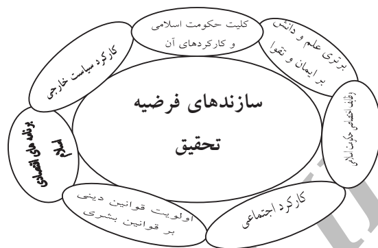
شکل شماره ۳: ساخت نگرش و تأثیر آن بر ارزشها و شخصیت انسانی