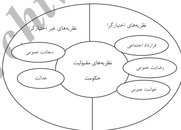
شکل شماره ۲: نظریه‌های اختیارگرا و غیراختیارگرا

از منظر جغرافیای سیاسی مقبولیت حکومت‌ها به حق حاکمیت عمومی مربوط است و افراد یک کشور که صاحب و مالک سرزمین خود می‌باشند، در تعیین چگونگی اداره و افراد اداره کننده آن صاحب اختیار می‌باشند. بنابراین در چهارچوب ارزشهای پذیرفته شده هر جامعه، سازمان سیاسی موظف است که کارکردهای خود را تنظیم کرده و نیازها و انتظارات مردم را برآورده کند. در حال حاضر ملاک نهایی مشروعیت، پذیرش و ارزیابی (گرایش) مردم است و این ملاک مبتنی بر ارزشهای مردم در یک زمان و مکان مشخص می‌باشد (رفیع‌پور، ۱۳۷۶: ۴۵۵). مقبولیت حکومت در حقیقت پاسخی است به این سؤال اساسی که چرا مردم باید از فرامین حکومت پیروی کنند؟ در پاسخ به این سؤال دست کم پنج نظریه: قرارداد اجتماعی، رضایت عمومی، خواست عمومی (خواست اکثریت)، عدالت و سعادت عمومی مطرح شده است. از پنج نظریه فوق سه نظریه اول مسأله مشروعیت را به خواست و اراده مردم وابسته می‌داند که به نظریه‌های اختیارگرا معروفند و نظریه‌های دیگر با ارزشهای اخلاقی و معنوی مرتبطاند و نظریه‌های غیراختیارگرا نامیده می‌شوند (لاریجانی، ۱۳۷۸: ۱۶).