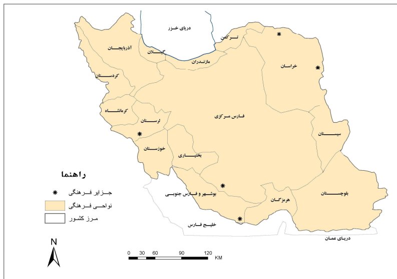
نقشه شماره ۱: نواحی فرهنگی رسمی ایران

۴-۲- نواحی فرهنگی کارکردی ایران: کشورها برای اداره بهتر سرزمین ناگزیرند آن را به واحدهای سیاسی-اداری کوچک‌تر تقسیم کنند. شاید تنها در مورد کوچک‌ترین کشورها امکان دارد تا از پایتخت یک کشور، بدون اتخاذ یک یا چند طبقه واسطه اداری، به طور کامل و مستقیم بر سرزمین آن کشور حکومت کرد (مویر، ۱۳۷۹: ۲۵۱). در این میان بسته به نوع حکومت و ویژگی‌های سیاسی-جغرافیایی آن دولتها نوعی از تقسیمات کشوری و