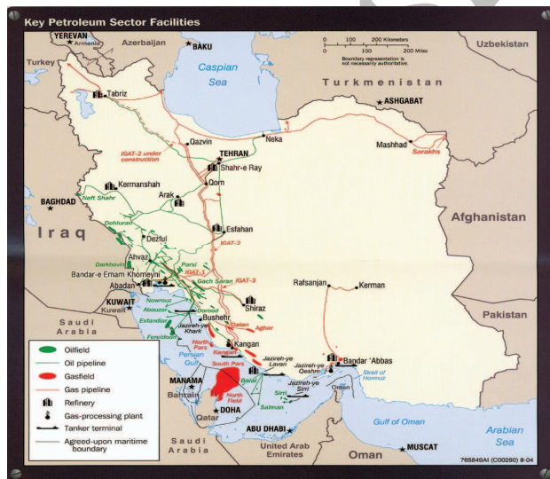
نقشه شماره ۲: منابع نفت و گاز و خطوط انتقال آنها

توسعه مشارکت‌های خود در انرژی با کشورهای دیگر دارد که ایران یکی از این کشورهاست. ایران در حال حاضر مرکز ثقل مهمی در ساختار امنیت انرژی چین محسوب می‌شود و در ابتدای سال ۲۰۰۵ در رتبه سوم کشورهای صادرکننده نفت به چین بوده. ایران در ابتدا تنها ۱۴٪ از نیازهای وارداتی نفت چین را تأمین می‌کرد اما بعد از امضای یکسری توافقنامه‌هایی در سالهای ۲۰۰۵ و ۲۰۰۶ میلادی، به یکی از بزرگترین صادرکنندگان نفت به چین مبدل شد (مادسن، ۲۰۰۷/۶/۱۲).