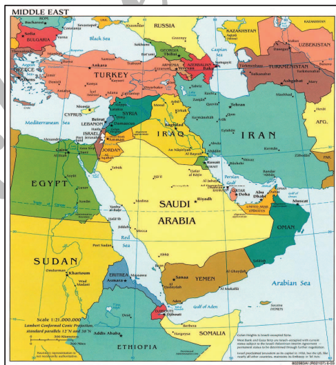
نقشه شماره ۱: موقعیت ایران در خاورمیانه

از سویی دیگر ایران با توجه به موقعیت ترانزیتی خود که ناشی از برتری‌های ژئوپلیتکی، یعنی قرارگیری در چهارراه بین‌المللی، حائز اهمیت است. این چهار راه آفریقا را به آسیا و آسیا را به اروپا متصل می‌کند.