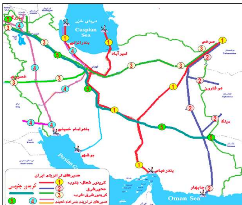
نقشه شماره ۲: مسیرهای اصلی و بنادر ترانزیتی در ایران (شمال - جنوب و شرق - غرب)