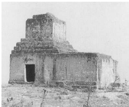
تصویر شماره ۴: مقبره تاش کوله در فوکایا - منبع: (Cahill, 1988: 486)

تکه‌های سفال با نقوش مختص دوره هخامنشی به‌دست آمده است اما مهمترین اثر پارسی در آن، مقبره تاش کوله واقع در ناحیه فوکایاست که متأثر از مقبره کوروش است (تصویر شماره ۴). (Cahill, 1988).