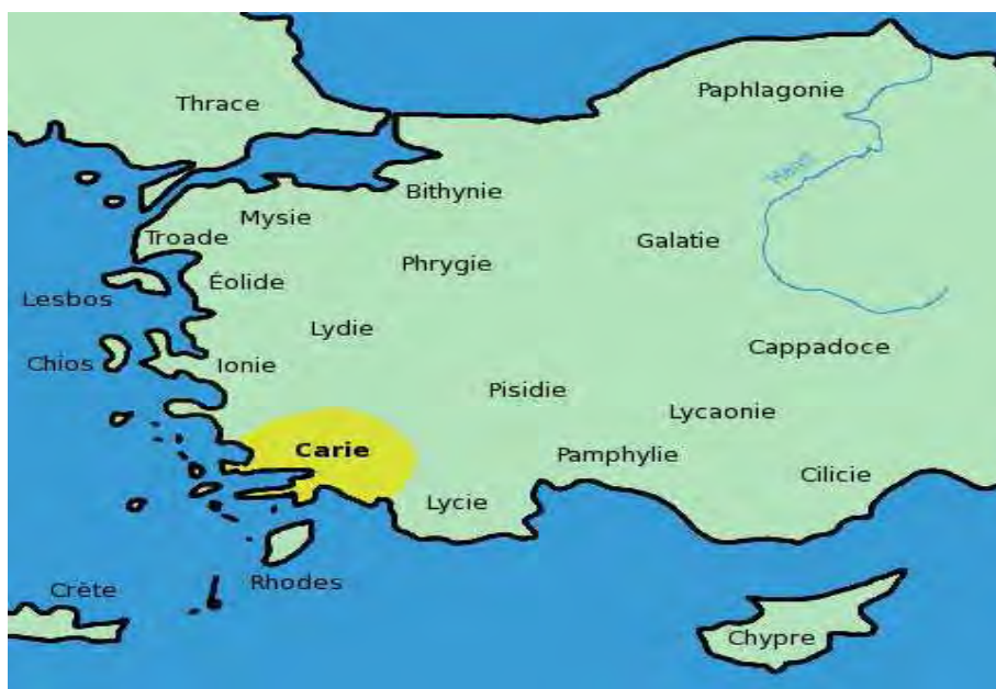
نقشه شماره ۱: شهرهای کهن آسیای صغیر

کرد. این امر در پی سیاست «بازسازی امپراتوری» و برای آسان‌تر کردن سیستم دریافت خراج و فراهم کردن سهمیه نظامی برای این واحدها انجام شد. بعد از دوران اردشیر اول و در دوران پادشاهان بعدی باز هم تغییر و تحولاتی در این مناطق روی داد؛ نحوه اداره این مناطق نیز در طول دوران امپراتوری متغیر بوده است. با بررسی متون و شواهد و آثار مادی مناطق زیر به‌عنوان خسترپاون‌نشین‌های هخامنشی در آسیای صغیر معرفی می‌شوند (نقشه شماره ۱).