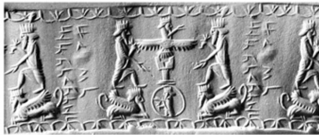
تصویر شماره ۶: مهر سیلندری مکشوفه از گوردیون

از سایت باستانی دژتپه در گوردیون از فاز هخامنشی، دو ساختمان به نام‌های ساختمان موزاییک و ساختمان منقوش به دست آمده که موتیف‌های نقاش‌های ساختمان منقوش، هخامنشی است (Voigt, 1999). از سایت‌های دیگر این محوطه تعدادی مهر و اثر با دورن مایه‌های پارسی به دست آمده که مهمترین آنها مهر استوانه‌ای معروف گوردیون است که موقعیت اداری آنجا را اثبات می‌کند (تصویر شماره ۶) (Dusinberre, 2005).