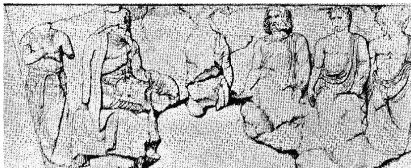
تصویر شماره ۲: پانل غربی یادمان پایاوا در لیکیه