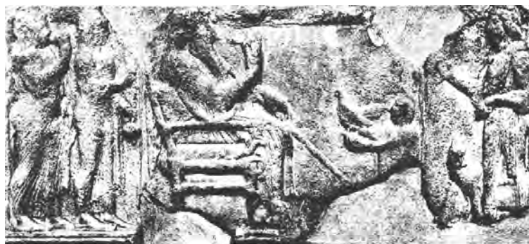
تصویر شماره ۱: (ب) نقش برجسته وجه شرقی یادمان هارپی‌ها در لیکیه