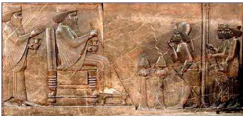
تصویر شماره ۱: (الف) صحنه بار داریوش شاه در تخت جمشید