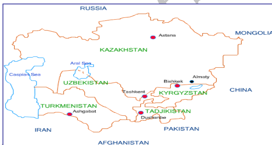
نقشه شماره ۱: آسیای مرکزی؛ (Ibid)

مختلف، در ساختار قدرت منطقه سهمی برای خود بیابند. از اینرو، در سال‌های اولیه پس از استقلال با توجه به معطوف شدن توجه روسیه به مشکلات داخلی، فرصتی برای قدرت‌های منطقه‌ای و فرامنطقه‌ای به وجود آمد. تا با توجه به عواملی همچون ارزش ژئوپلیتیک و ژئواستراتژیک آسیای مرکزی و قفقاز، منابع و ذخایر فراوان نفت و گاز خزر، موقعیت گذرگاهی، ارتباطی و ارزش استراتژیک دریای خزر و دریای سیاه، کنترل تولید منابع و خطوط لوله انرژی، توان تأثیرگذاری بر بحران‌های منطقه و علایق مشترک فرهنگی، تاریخی و اقتصادی میان کشورهای منطقه برخی همسایگان، برای تحقق اهداف خود و پر کردن خلاء قدرت در آسیای مرکزی و قفقاز به رقابت با یکدیگر پردازند (Hafeznia & et al, 2007: 97).