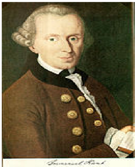
تصویر شماره ۳: ایمانوئل کانت، جغرافیدان و فیلسوف آلمان

ایمانوئل کانت در برنامه تدریس و در آثار خود در نیمه قرن هیجدهم میلادی از اصطلاح جغرافیای سیاسی که در زبان آلمانی پولیتیشه گیوکافی ۱ تلفظ می‌شود استفاده نمود (پولیتیشه جئوگرافی). در مورد تاریخ دقیق کاربرد این اصطلاح توسط کانت روایت‌های گوناگونی وجود دارد و دقیقاً مشخص نیست چه زمانی برای اولین بار کانت از آن استفاده کرده است. زیرا کارهای کانت و تدریس‌های او توسط دانشجویانش در سال‌های بعد تنظیم و تدوین شده است. مانند هردر ۲ ، هسه ۳ ، کهلر ۴ و غیره. در این آثار اصطلاح جغرافیای سیاسی و مفهوم آن تا حدی بیان گردیده است. در واقع کانت جغرافیای سیاسی و سایر شاخه‌های جغرافیا را در چارچوب برنامه تدریس خود در زمینه جغرافیای طبیعی بیان کرده است (Stark, 2013: 1). کانت پس از شروع تدریس خود در زمینه جغرافیای طبیعی، در سال ۱۷۵۷ اظهار داشته که از