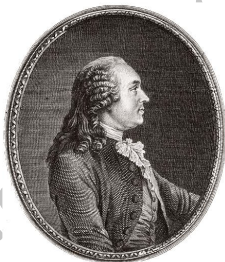
تصویر شماره ۱: آن روبرت ژاک تورگو، بنیانگذار جغرافیای سیاسی در سال ۱۷۵۱م

دولابلاش در جغرافیای انسانی مورد نظر خود، عملاً جغرافیای سیاسی را نادیده گرفت در حالی که به‌طور هم‌زمان، در آلمان فردریش راتزل جغرافیای سیاسی را با موضوع کشور و حکومت تبیین نمود. در واقع جغرافیای انسانی ویدال دولابلاش همان جغرافیای سیاسی تورگو بود که بُعد سیاسی آن توسط دولابلاش مورد غفلت قرار گرفت و تغییر عنوان پیدا کرد (Robic, 2013). البته ویدال دولابلاش، اقدام راتزل برای ایجاد شاخه جغرافیای سیاسی را نیز مورد انتقاد قرار داد (Herb, 2008: 28).