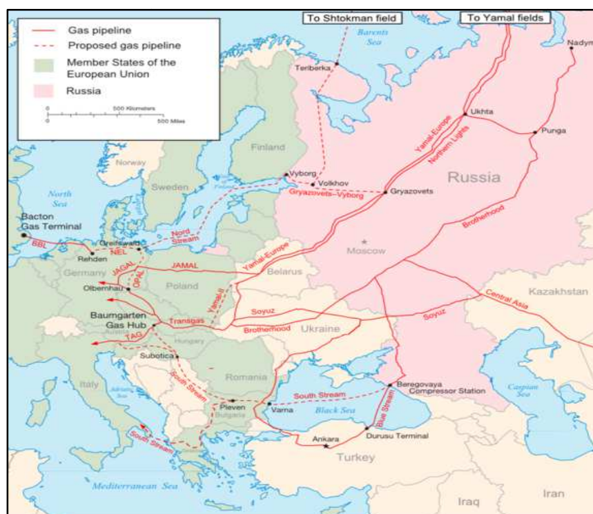
شکل شماره ۳: اصلی‌ترین خطوط لوله گاز طبیعی بین روسیه و اروپا ۲

در ادامه به اقدامات دیگر روسیه و اروپا در مورد این مناقشه پرداخته می‌شود. شکل شماره ۳ اصلی‌ترین خطوط لوله گاز طبیعی بین روسیه و اروپا را نشان می‌دهد. خط لوله جریان شمالی ۱ هم‌اکنون ساخته شده است.